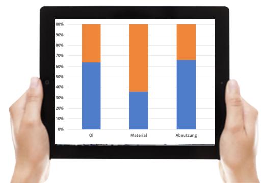
(Maschinen)daten verfügbar auf allen Endgeräten in Echtzeit.