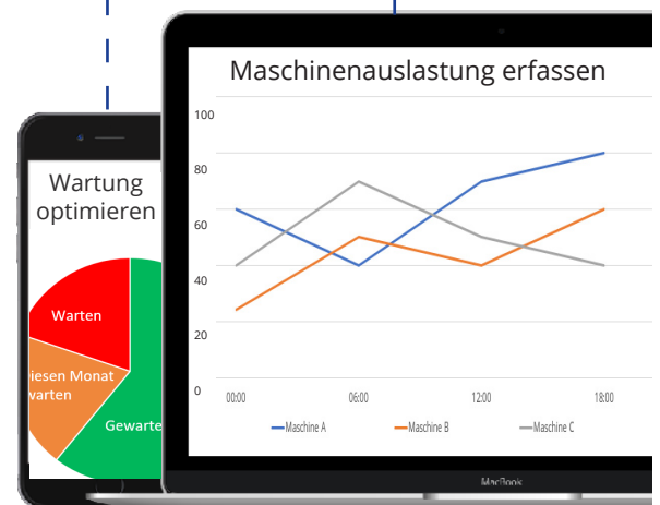
Smart Industry Apps: Anpass- und erweiterbar an Ihre Anforderungen