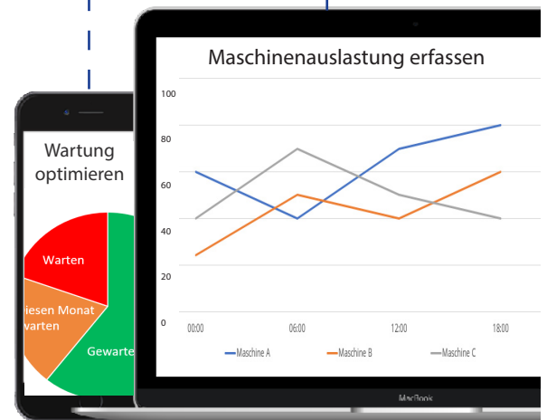
Smart Industry Apps: Anpass- und erweiterbar an Ihre Anforderungen