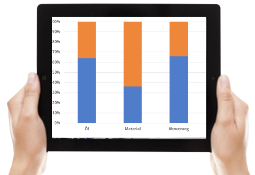
(Maschinen)daten verfügbar auf allen Endgeräten in Echtzeit.